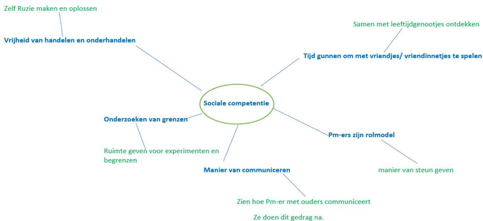
Figuur 1 Overzicht van de sociale competentie